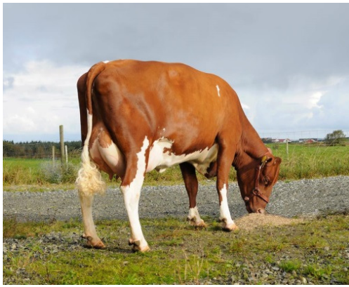
Raza Rojo Noruega