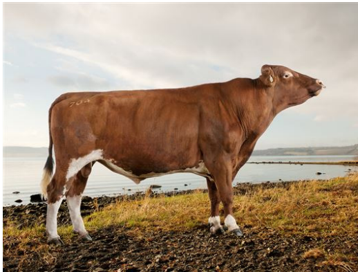
10704 Tranmael II (ESTA FOTO LA TIENES)