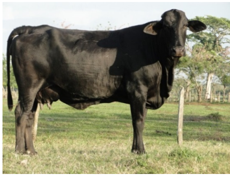
F1 Brahman x Holstein

cruzamiento que permitan obtener crías que cumplan con la expectativa productiva del ganadero?