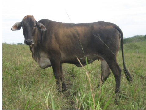
F1 Brahman x Pardo Suizo

En muchas de las ganaderías doble propósito del país son utilizadas razas de origen europeo especializadas en producción de leche para la obtención de crías F1 sobre una base cebuina ( Bos Indicus ). Con este sistema de cruce entre razas, logran obtener hembras importantes productoras de leche con cierto grado de rusticidad, pero con los machos no se obtiene tan buen desempeño para programas de engorde y ceba ya que genéticamente no tienen este potencial.